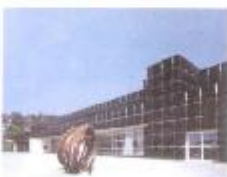
Exterior view of the Musée d'Art Moderne de Saint-Etienne Métropole

Infos et inscriptions auprès du : centre socio-culturel au 04 77 54 95 03